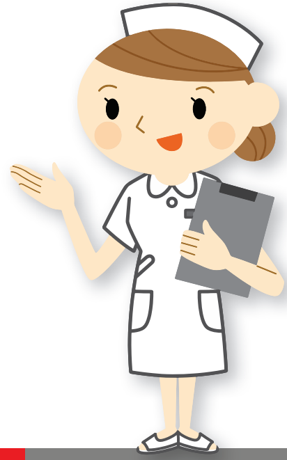
Verpleegkundige / Huisartsassistent