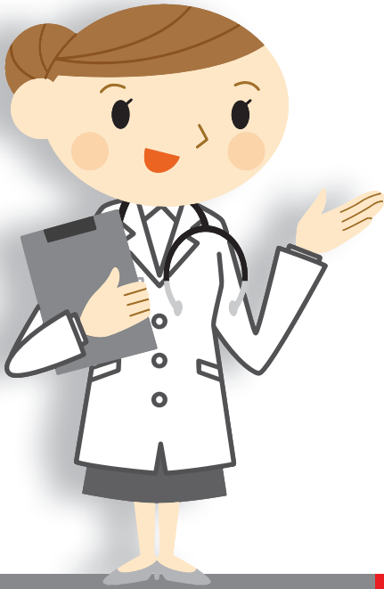
Huisarts / Specialist