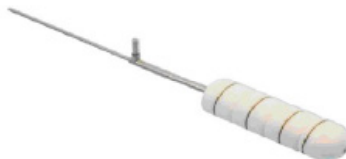
Vaginale cilinder, in lengte en diameter variabel

Inwendige bestraling wordt ook wel brachytherapie genoemd. Brachy betekent 'op korte afstand, dichtbij'. Bij deze behandeling wordt de vagina van dichtbij bestraald door middel van een cilinder, waarin zich een zeer dun, hol kunststof buisje bevindt. De cilinder wordt ingebracht in de vagina. Het kunststof buisje en de cilinder steken uit de vagina naar buiten. Dit kunststof buisje wordt door een dunne toevoerslang verbonden met het bestralingsapparaat. Vanuit het bestralingsapparaat wordt de bestralingsbron in de cilinder gebracht. De bestralingsbron zal in de cilinder van binnenuit de straling afgeven, precies op de plek waar deze moet komen. Het bestralingsapparaat staat in de brachytherapie ruimte en wordt vanuit de ruimte er naast bediend. Tijdens de bestraling is er camera- en intercom toezicht.